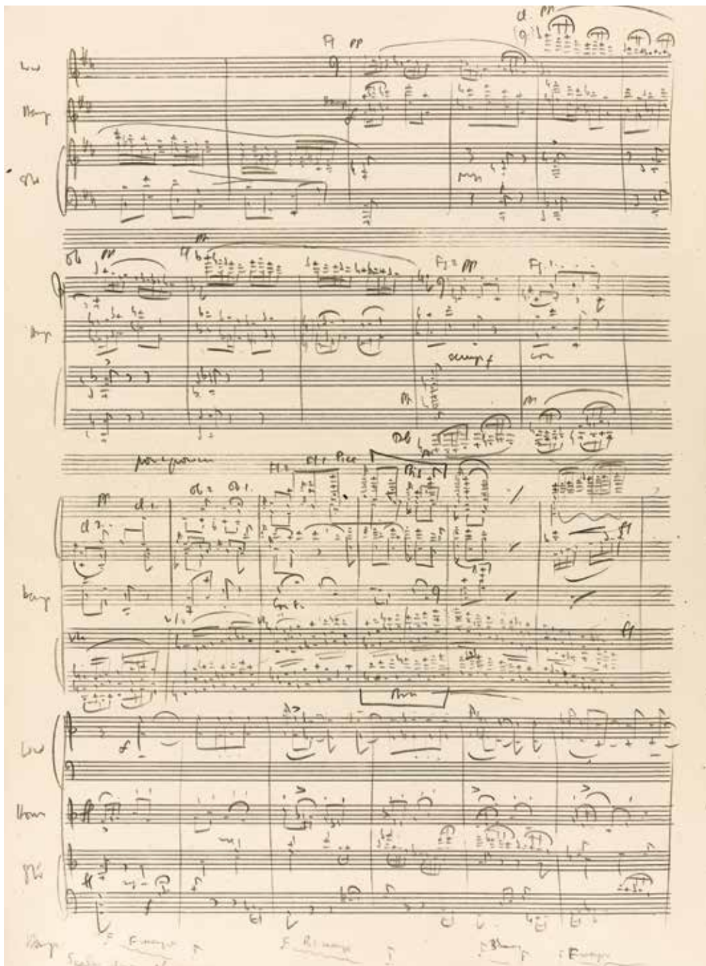
СТРАНИЦА АВТОГРАФА «ПУТЕВОДИТЕЛЯ ПО ОРКЕСТРУ» Б. БРИТТЕНА

Перед входом в дом Бриттена висела табличка «Осторожно, злая собака!» на нескольких языках – для друзей из разных стран, – в том числе и на русском.